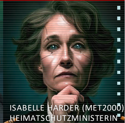
ISABELLE HARDER (MET2000) HEIMATSCHUTZMINISTERIN